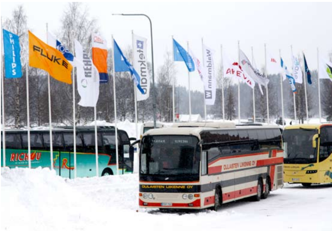
Näytteilleasettajien lippurivistö seisoo tervehtimässä messuille kaikkialta maasta tulevia kymmeniä linja-autoja.