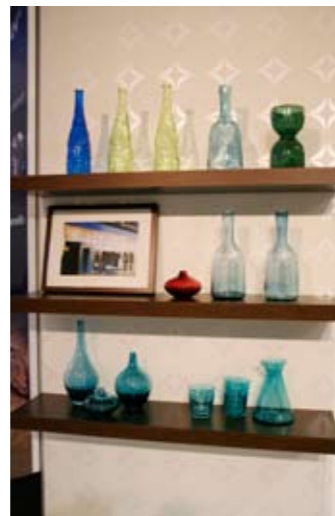
Kirjähylly koristuksineen luo kodinomaista tunnelmaa.

Osastojen tärkeintä antia ovat kuitenkin edelleen iloiset ihmiset ja palveluaitis asenne. ■