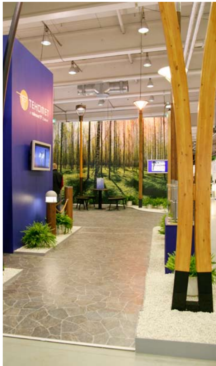
Jos tarkoitus on myydä katuvaloja, niin miksipä ei rakennettaisi katua. Yksinkertainen, mutta taatusti toimiva ratkaisu.