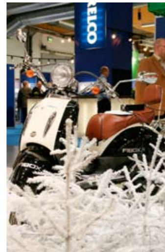
Moottoripyörä on moottoripyörä, mutta skootteri toimii somistuksena.