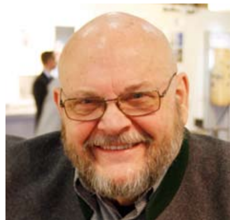
Hessulla pitää olla tekemistä, eikä tämä eläkevaari ehdi ainakaan sammaloitua.